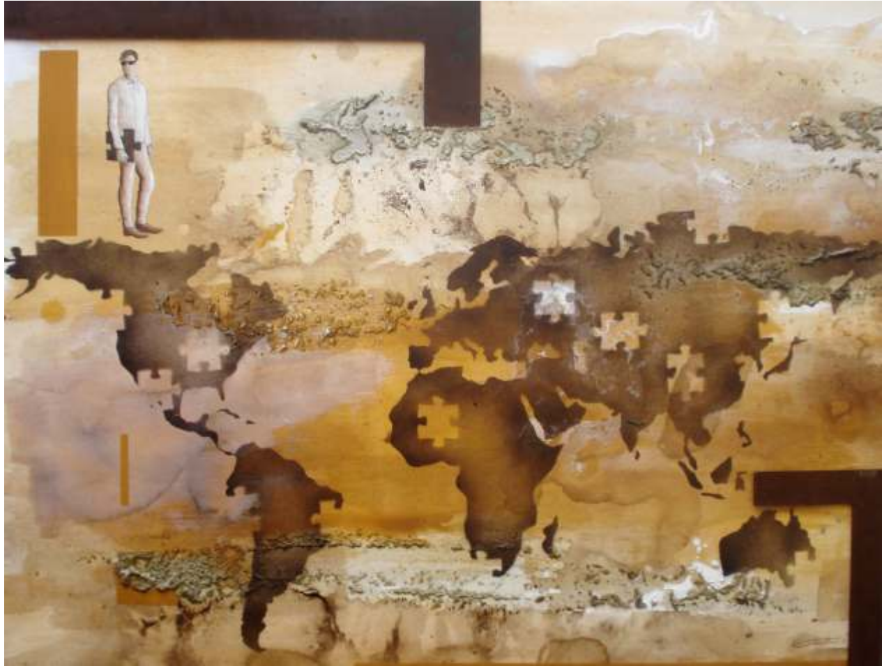
La consciència i les cames seguien direccions oposades, i així començarem a construir un demà buit de les faules i mites del passat (97x130)