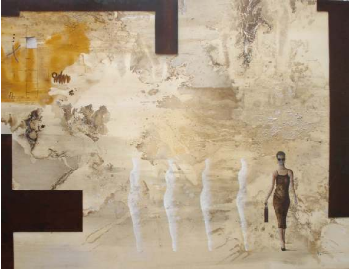
I em va dir: "ets un pintor de blancs i negres". Tot al contrari que ell, però els dos miram sempre la lluna (97x130)