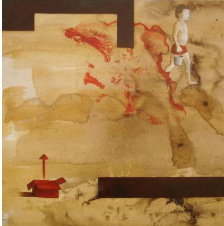
Només per a aquells que intenten d'entendre el seu vol, els ocells parlen (70x70)