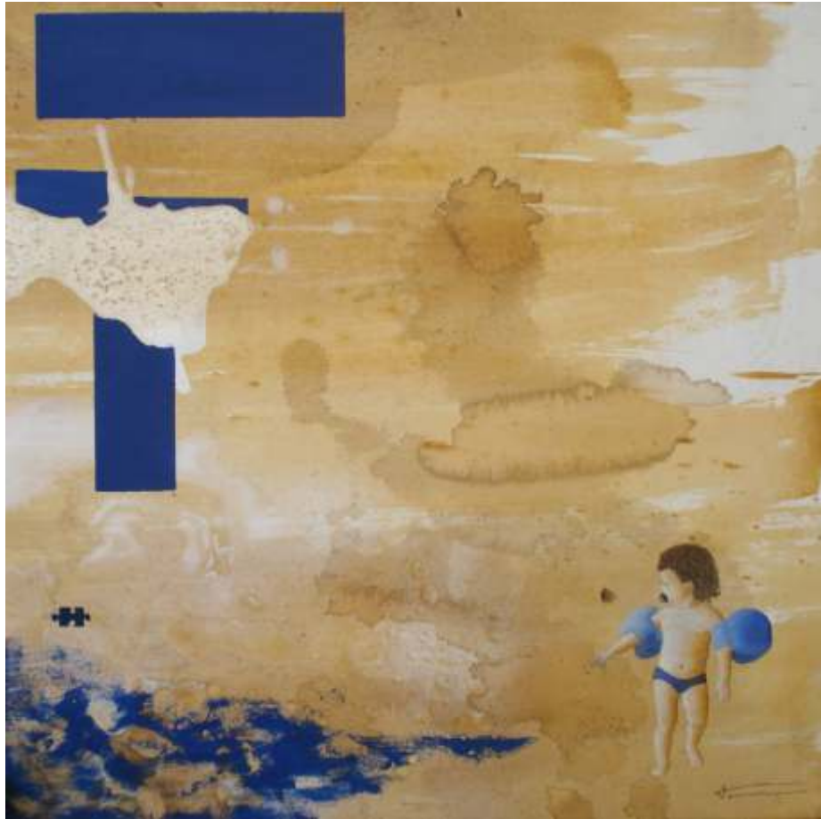
Oblidava els meus jocs, a fi de veure com ella descobria el món, assaborint intensament cada experiència, amb els peus plens d'arena (70x70)