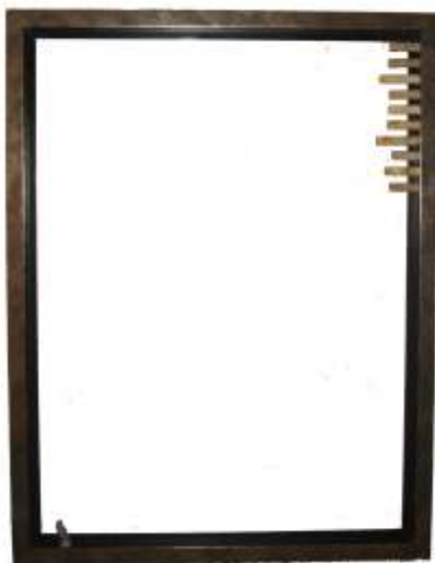
Joc en transició