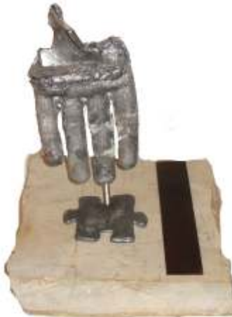
Interioritzant les normes