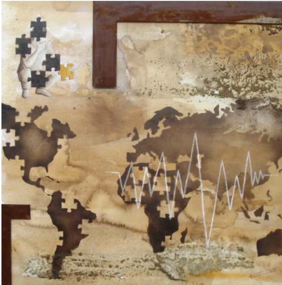
La solució era tan evident com utòpica, són cicles, com un peix que es mossega la coa (100x100)