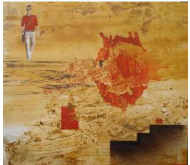
Et quedes sol amb el cor ple d'imatges clares i amb el repòs d'haver triat les passes fetes (80x90)