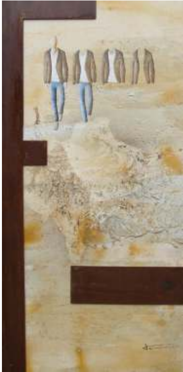
Els anys avancen incessants i nosaltres, amb la claror de l'alba, retrocedim (80x40)