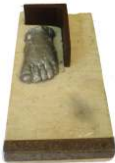
Ella, dos i mig