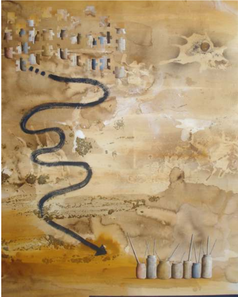
Començava aquest joc enmig d'aquelles quatre parets, i allà els vaig veure, inquietos i neguitosos, a punt de parlar (150x120)