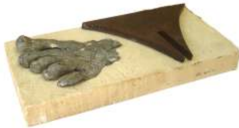
Mil nou-cents noranta-nou