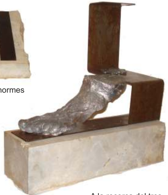
A la recerca del tres