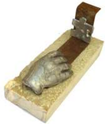
Preludi del somni