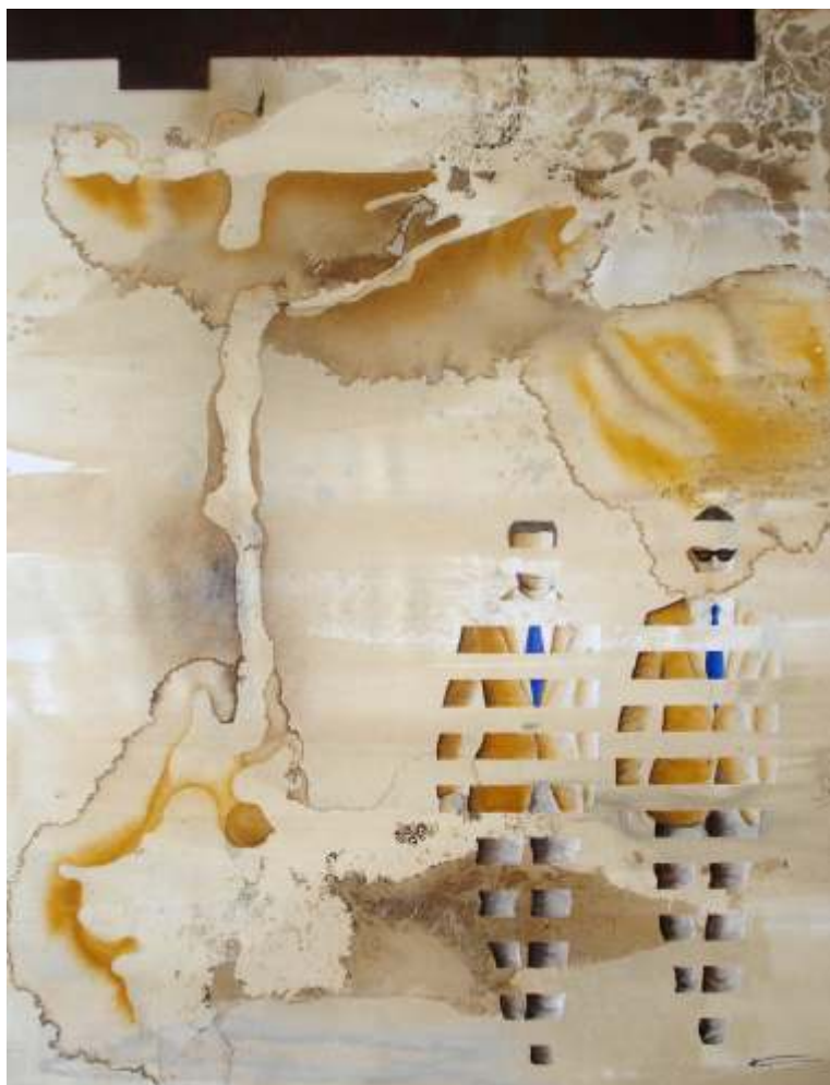
Sinapsi: és la unió entre neurones mitjançant impulsos elèctrics (130x97)