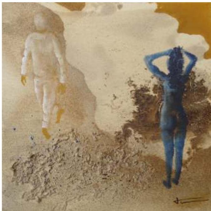
Hi ha incendis breus, instants perfectes, llampecs de far, que perduren tota una vida... mil nou-cents noranta-nou (30x30)