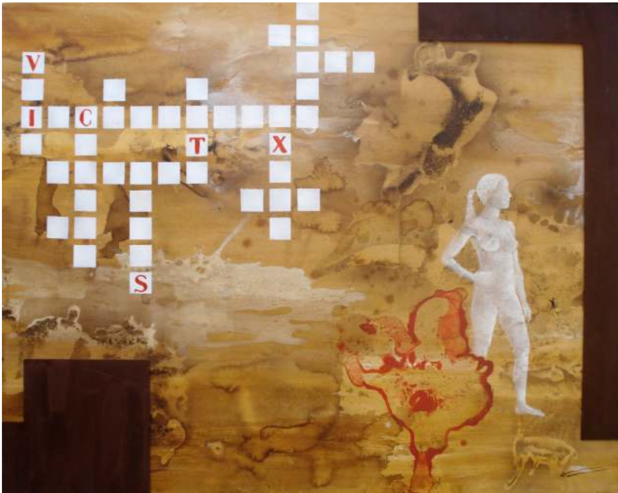
Jo veig totes les nits incendiades per l'excés de claror de tantes pells (120x150)