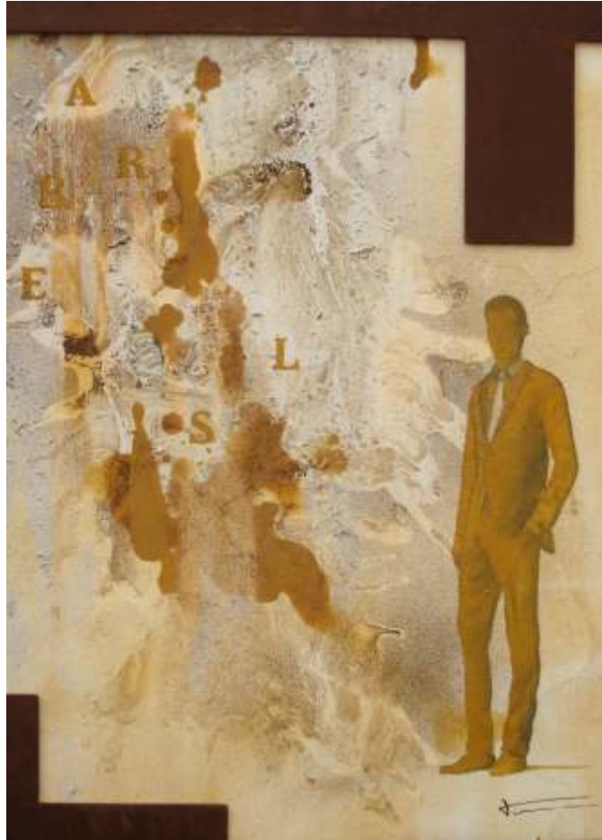
De tu he heretat la llengua, malmenada i desatesa, però n'he perdut els matisos (55x40)