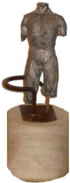
L'acabament del joc