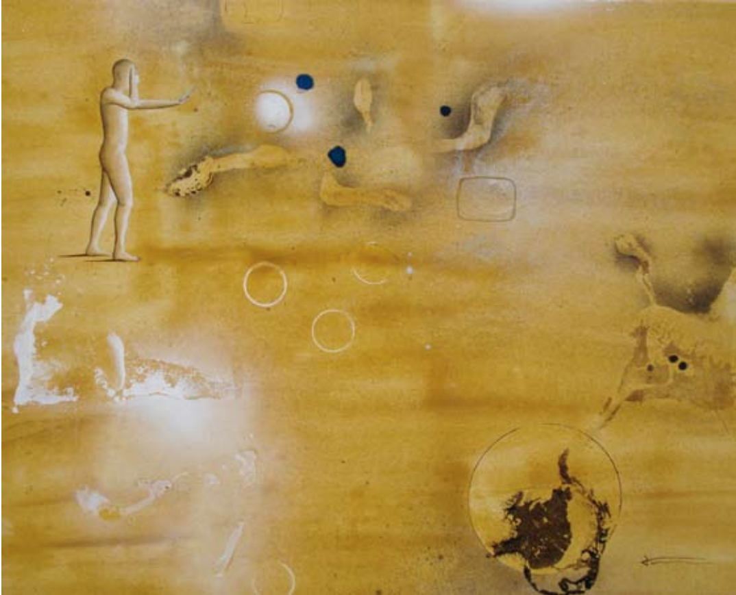
¿Y MAÑANA? - 81 X 100