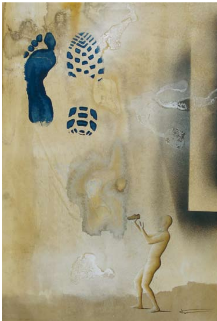
LA MEJOR OPCIÓN - 60 X 90