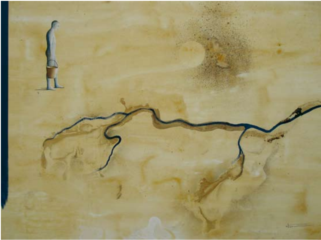
LOS RIOS SE SECAN - 97 X 130