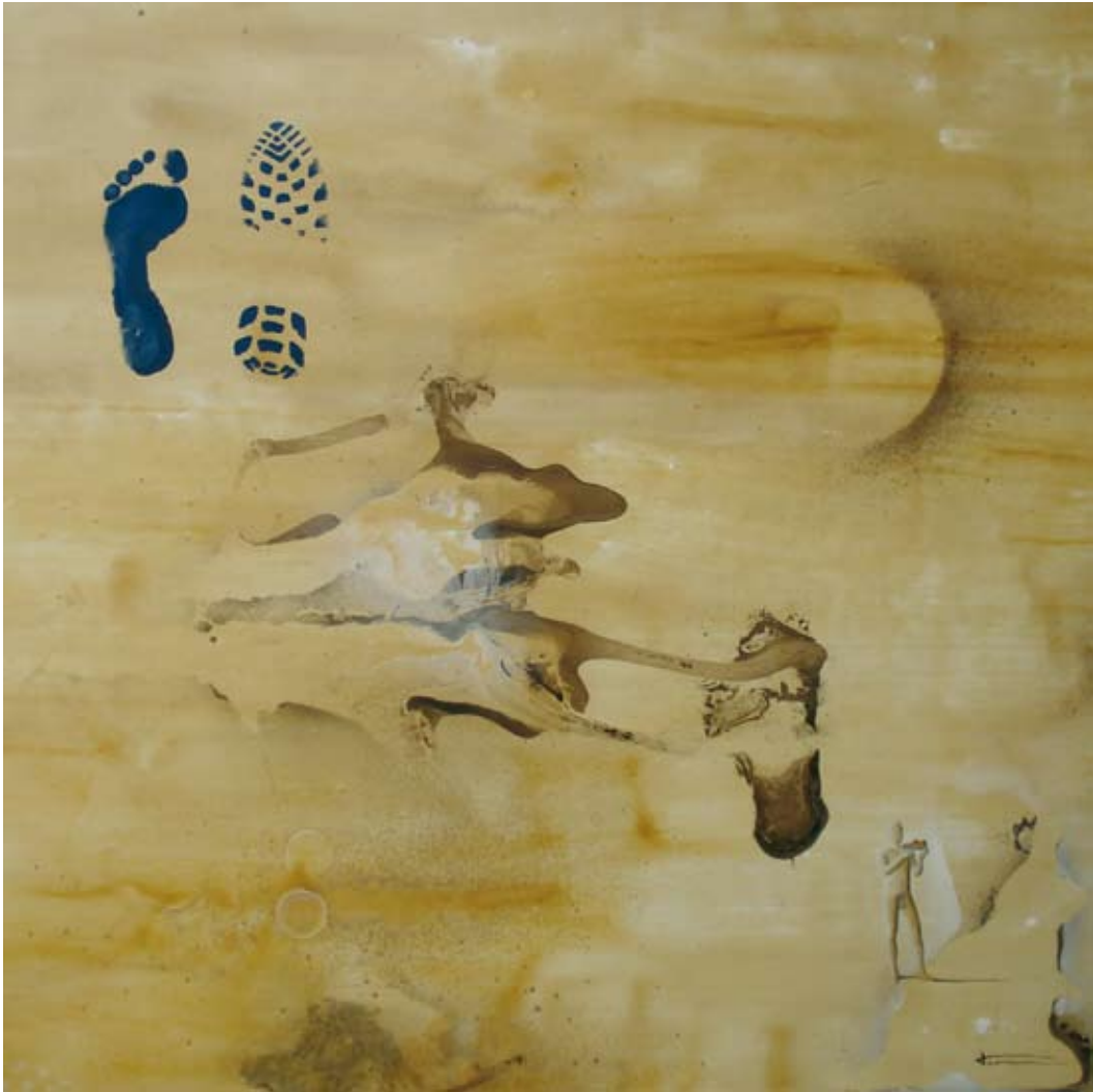
LEJOS DE NUESTRA ESENCIA - 130 X 130