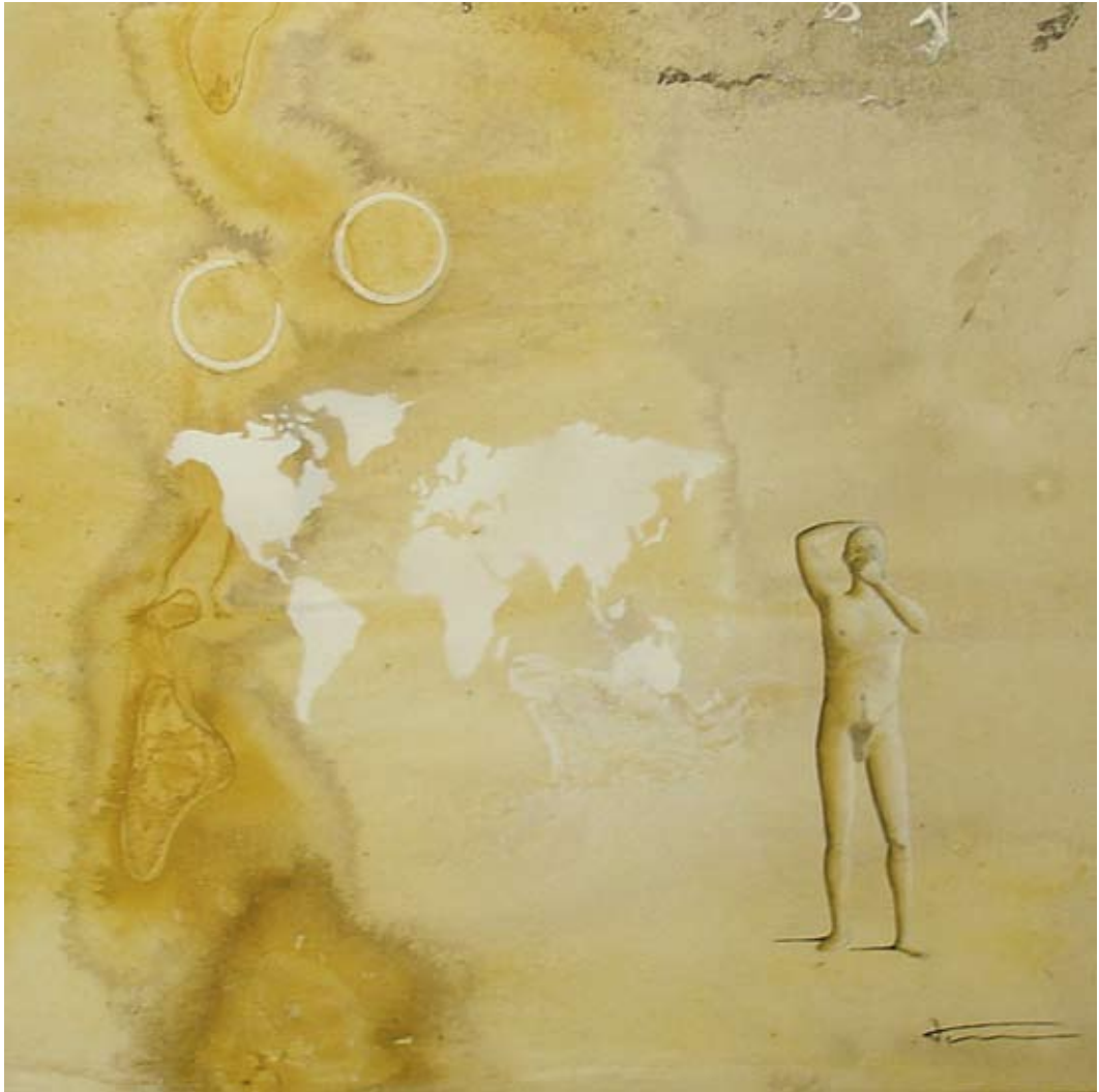
MAL CAMINO - 60 X 60