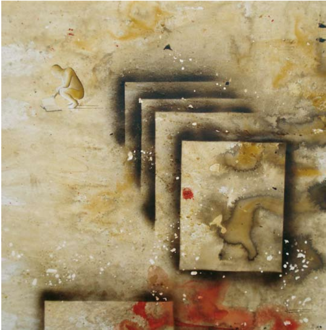
ESTUDIANDO EL PRESENTE - 130 X 130