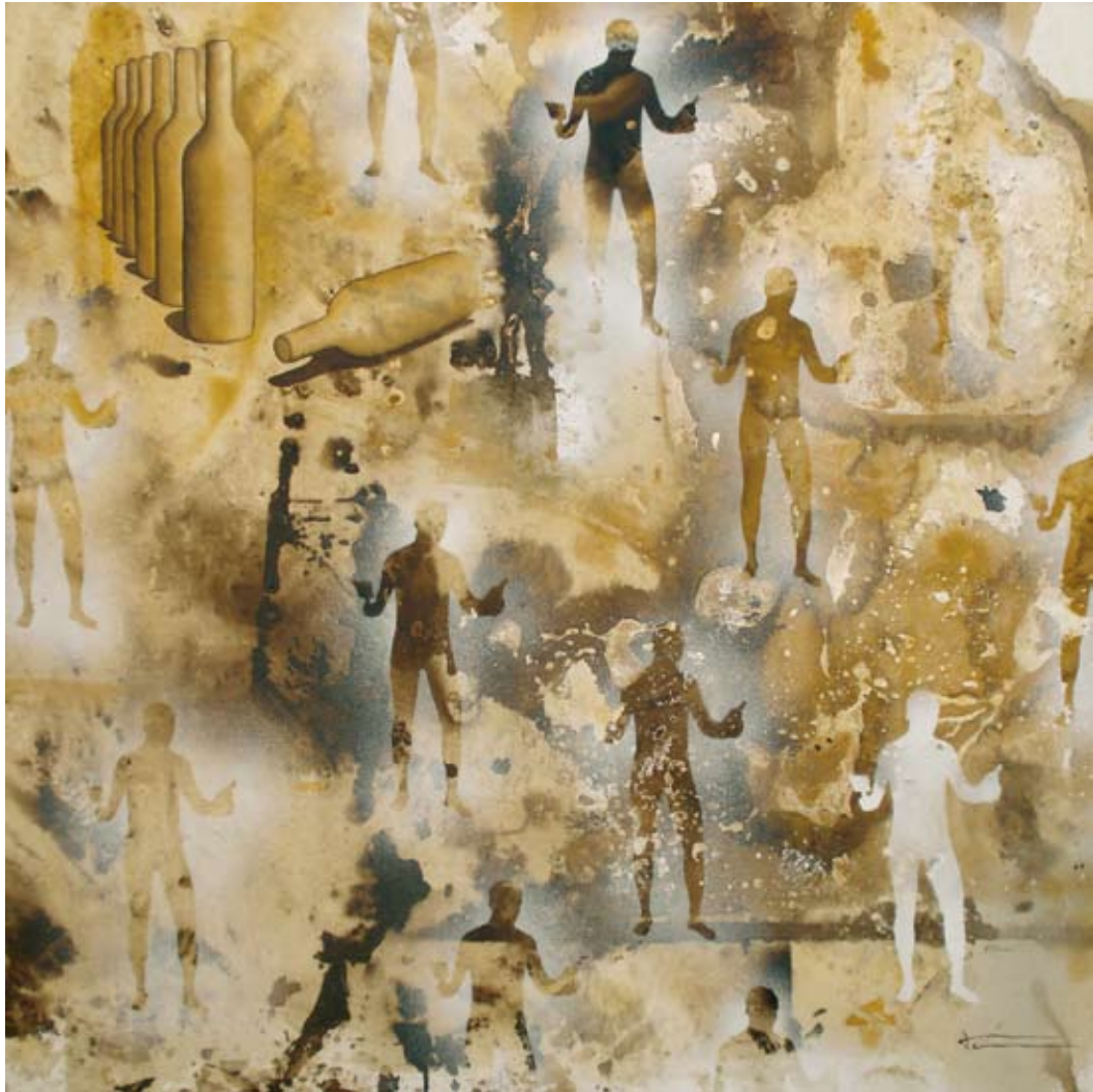
¿PINCEL O BETELLA? - 100 X 100