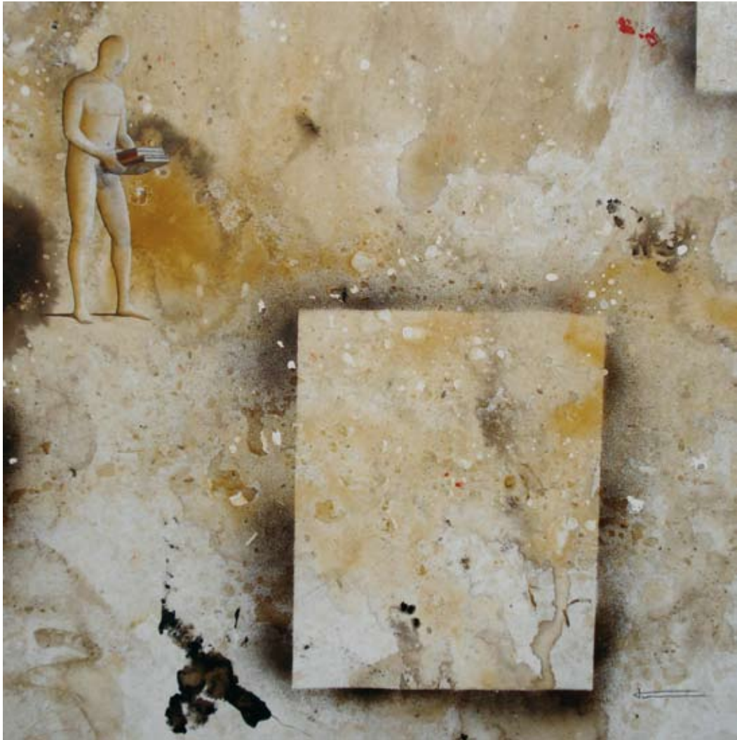
APRENDIZAJE - 100 X 100