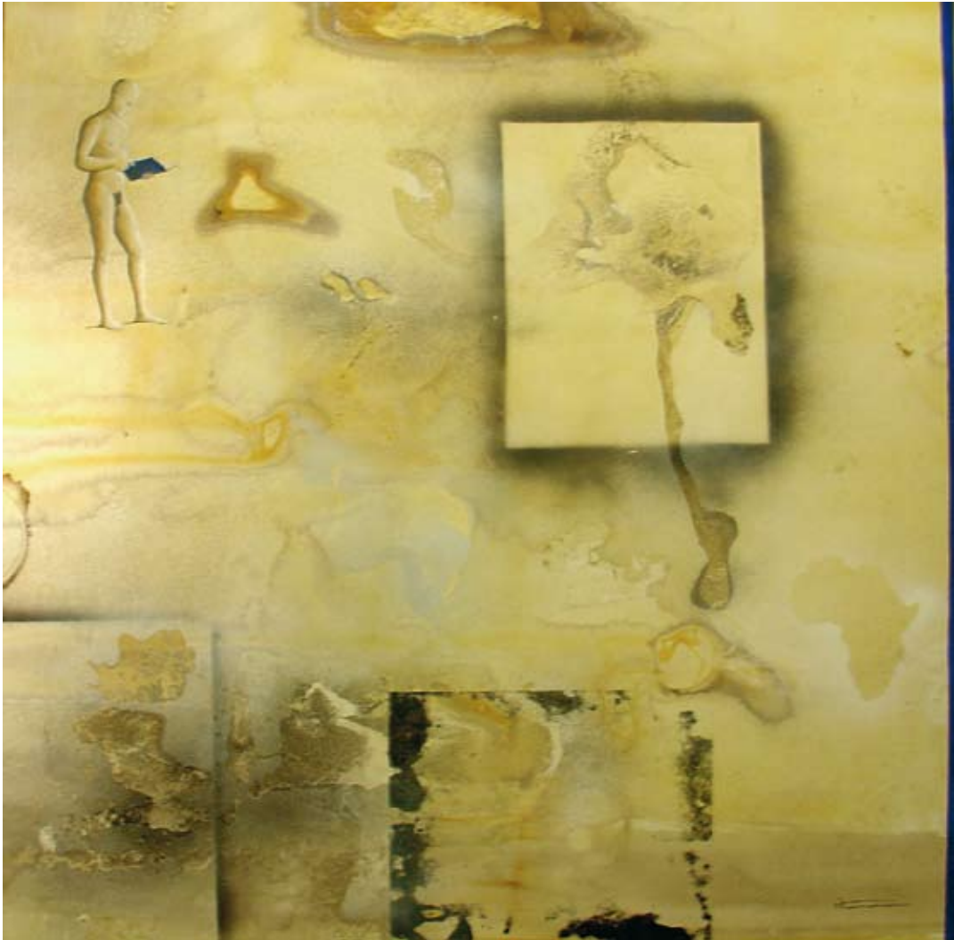
PAPELES MOJADOS - 150 X 150